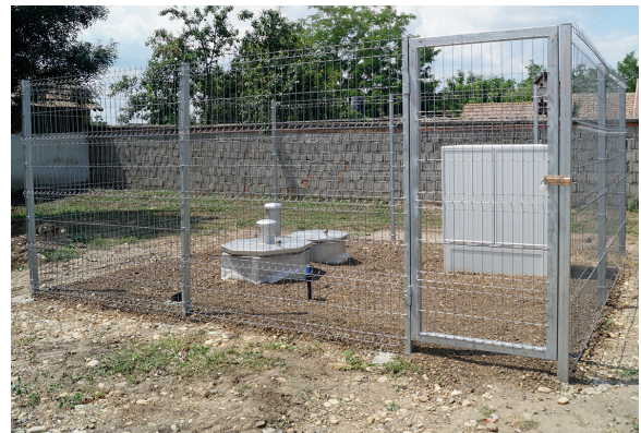
Kompakt sjakt og kontrollskap etter montering

Sjaktmantelen består av en kantet, 3 mm tykk og tett sveiset plate i rustfritt stål. Som avstivning er det sveiset på deler av flatt materiale hele veien rundt på utsiden. En monteringsåpning DN 600 med kuppel (H = 800 mm) og sjaktlokk for pumpemontering og en tilgangsåpning DN 800 med kuppel (H = 800 mm) og sjaktlokk med ventilasjonshatt er sveiset tett inn i toppdekelet.